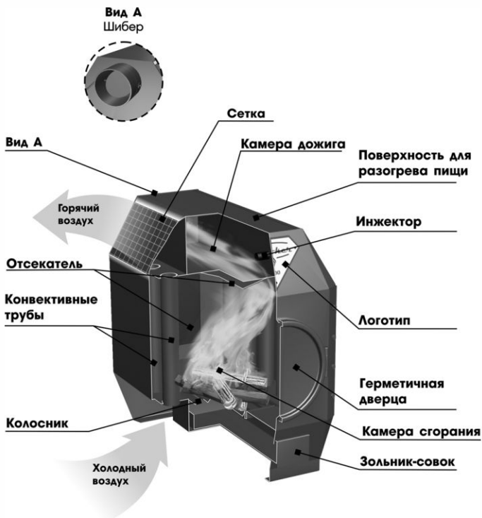
Рисунок - 1. Схема работы печей длительного горения.