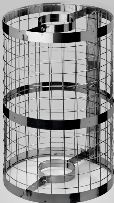
Сетка для камней